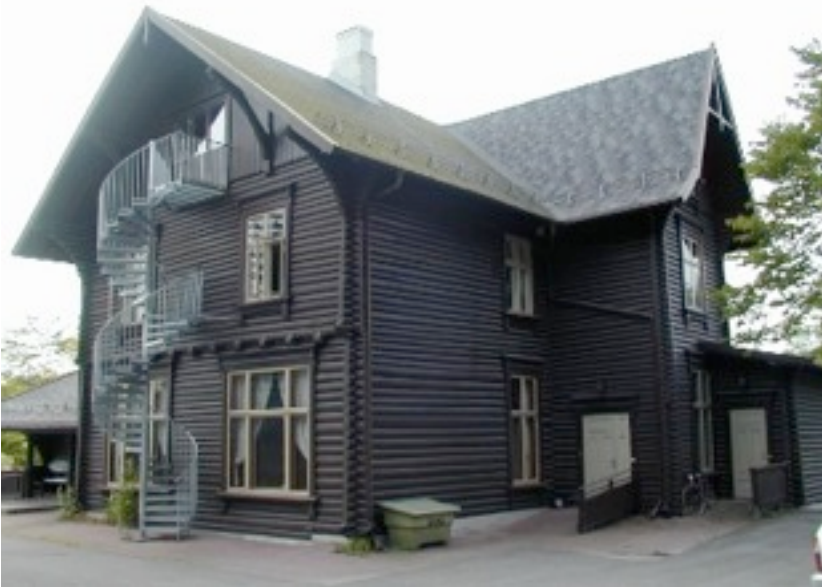
Kontorer i Løkkeåsveien 2, Sandvika